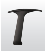
AR011 - 3