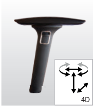
AR097/098+109 - 61