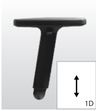
AR022/023 - 9