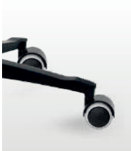
ST026 / ST031