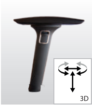
AR097/098 - 56